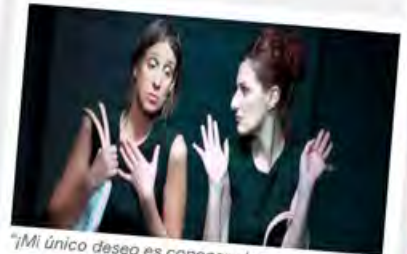
"Mi único deseo es conocer el mundo y las comedias que en él se representan!" (René Descartes)