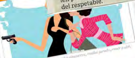
Dibujos: Félix Sabroso, José Sanchis Sinisterri, Maika Jurado, Roser Pujol, Yolanda García Serrano

Que el arte escénico no atraviese su mejor momento en este país no se puede negar. Las circunstancias no acompañan. Ya se ha disertado mucho sobre el asunto y es absolutamente justo y necesario que se continúe haciendo. Pero mientras esto sucede muchos artistas se enfrentan a una asfixiante realidad repleta de trabas, de negatividad, de imposibilidad de llevar a cabo sus proyectos. Aún así, no podemos rendirnos. Ahora no. Ahora menos que nunca. Es tiempo de agudizar el ingenio, de buscar nuevas fórmulas de acercarse al público, de abrir con ilusión y esfuerzo las puertas que se nos han ido cerrando.